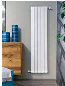
挤压铝暖气片以及 浴室装饰暖气片