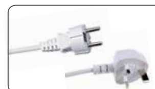
Fiche disponible Schuko o UK