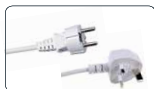
Fiche disponible Schuko o UK